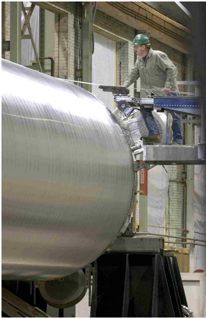
空气产品公司生产各种绕管式换热器的绕管工艺。