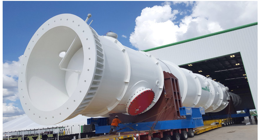
空气产品公司定制设计的大型绕管式换热器。

对于AP-X®液化天然气工艺，除液化工艺设计和绕管式换热器（CWHE）外，空气产品公司还设计和生产低温氮气增压膨胀机（增压透平膨胀机）和氮气节能换热器冷箱。