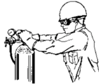
图 2: 正确的方法安全的检查系统.

由于氧化剂改变了起火的化学性质，在空气中不能燃烧的材料在氧化剂环境中可能能够点燃或剧烈反应。用于氧化剂设施的设备应选用能够最大程度降低点燃的可能性和起火或爆炸的危险的建材。必须清洁系统，去除任何污染物，如油脂或润滑油。还要注意去除任何残留的清洁剂。用在氧气系统的调压阀应该一直用在氧化剂设施中。如果调压阀用于其他类型设施，它可能不再满足氧化剂清洁的要求。