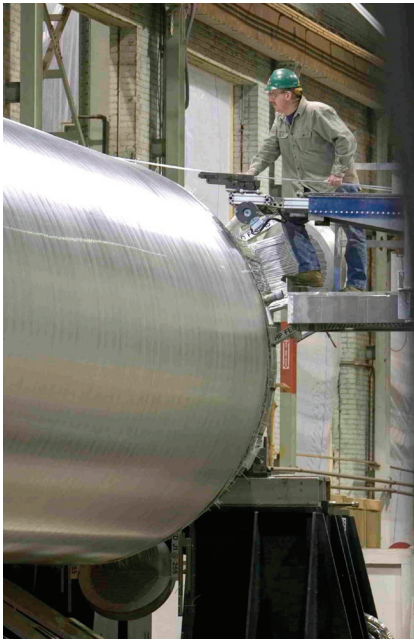
空气产品公司生产各种绕管式换热器的绕管工艺。